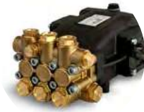
POMPE CULASSE LAITON