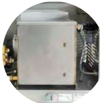
RÉSERVOIR EAU 12 LITRES