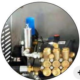
BYPASS ET TOTALSTOP