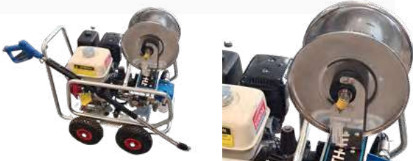
ENROULEUR INOX EN OPTION

Fiche Technique & éclaté disponibles sur suroil.fr