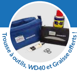
Trousse à outils, WD40 et Graisse offerts !