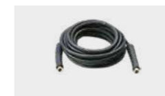
Flexible haute pression 10m