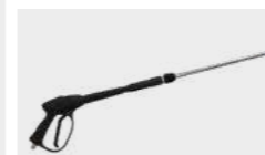
Lance avec pistolet 920mm