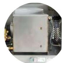
RÉSERVOIR EAU 12 LITRES