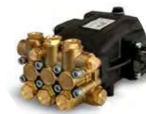
POMPE CULASSE LAITON