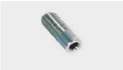
Buse M4 en inox