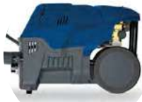
UTILISATION VERTI- CALE ET HORIZONTALE