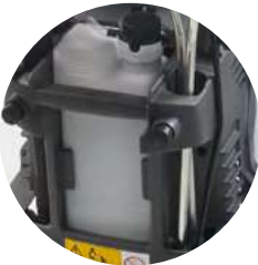
RÉSERVOIR AMOVIBLE ARRIÈRE