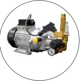
MOTOPOMPE AVEC CULASSE EN LAITON ET PISTONS EN ACIER INOXYDABLE