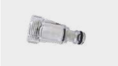
Filtre arrivée d'eau