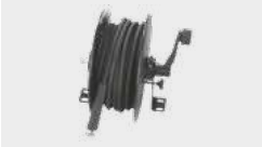
Flexible haute pression M22 15m sur enrouleur