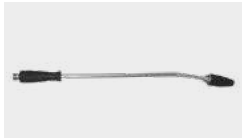
Lance avec rotabuse