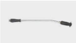
Lance à jet réglable avec buse