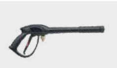
Pistolet avec protection