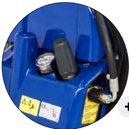
MANOMÈTRE ET VANNE