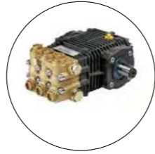
POMPE VILEBREQUIN TÊTE LAITON