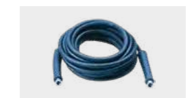
Flexible haute pression 20m R2 - 5/16"