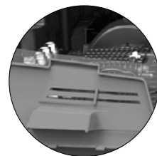
ACCÈS DE MAINTENANCE FACILE