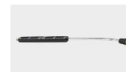
Lance coudée avec portebuse, 900 mm