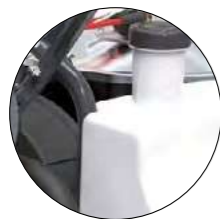
ANTI-CALCAIRE AVEC POMPE