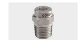
Buse H.P 25° 1/4" MEG 07