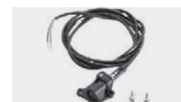
Kit de contrôle de flamme