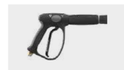
Pistolet avec extension et raccord tournant G 3/8" M